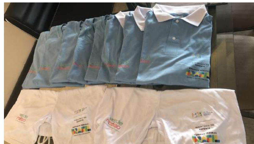
Camiseta e Shorts de Treino