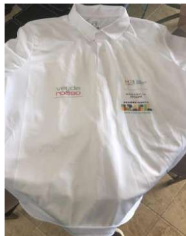
Camiseta de Jogo